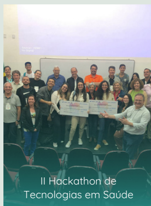
II Hackathon de Tecnologias em Saúde