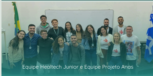
Equipe Healtech Junior e Equipe Projeto Anas